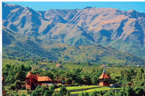
MERLO - SAN LUIS