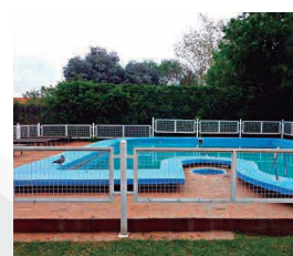
HOTEL CLIMA SOL