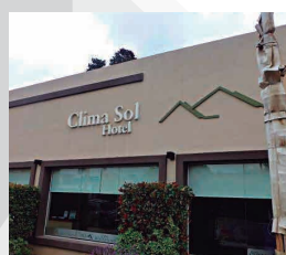
HOTEL CLIMA SOL